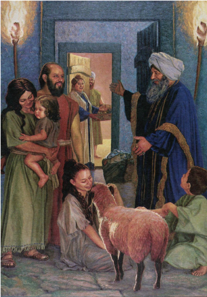
Los que disponen de medios ofrecen hospedaje, ropa o comida a los necesitados (Isaías 58:10)

9b En tal caso llamarías, y Jehová mismo respondería; clamarías por ayuda, y él diría: '¡Aquí estoy!'.