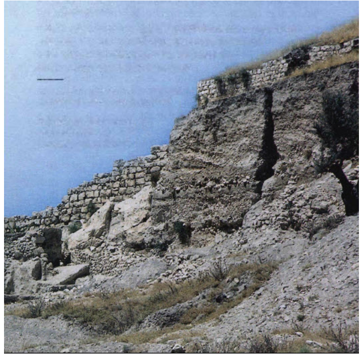
Si Judá se arrepiente, reconstruirá sus ciudades devastadas (Isaías 58:11)

tierra abrasada, y vigorizará tus mismísimos huesos; y tendrás que llegar a ser como un jardín bien regado, y como la fuente de agua, cuyas aguas no mienten.