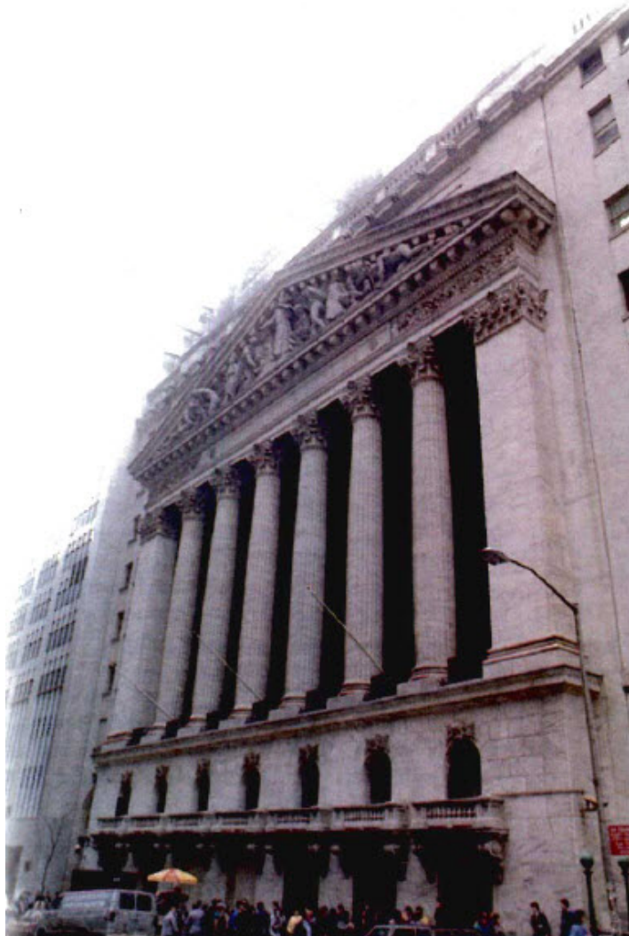
Quienes depositan su confianza en las posesiones materiales quedarán decepcionados (Isaías 31:1)