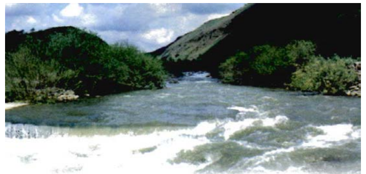
“Sobre toda colina elevada tiene que llegar a haber arroyos” (Isaías 30:25)

Y tus propios oídos oirán una palabra detrás de ti que diga: “ Este es el camino. Anden en él ”, en caso de que ustedes se fueran a la derecha o en caso de que se fueran a la izquierda.