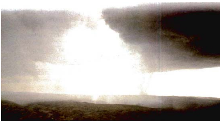
Jehová vendrá “con su cólera y con nubes pesadas” (Isaías 30:27)

23 Y él ciertamente dará la lluvia para tu semilla con la cual siembras el terreno, y, como el producto del terreno, pan, el cual tiene que llegar a ser graso y aceitoso. Tu ganado pacerá en aquel día en un prado espacioso. 24 Y las reses vacunas y los asnos adultos que cultivan el terreno comerán forraje sazonado con acedera, que habrá sido aventado con la pala y con el bieldo. 25 Y sobre toda montaña alta y sobre toda colina elevada tiene que llegar a haber arroyos, acequias de agua, en el día de la gran matanza cuando caigan las torres. 26 Y la luz de la luna llena tiene que llegar a ser como la luz del [sol] relumbrante; y la mismísima luz del [sol] relumbrante se hará siete veces mayor, como la luz de siete días, el día en que Jehová vende el quebranto de su pueblo y sane hasta la grave herida que resulte del golpe por él.