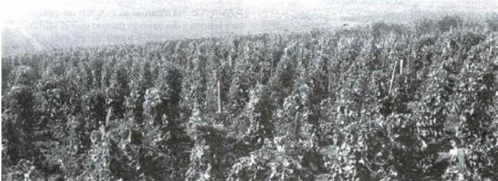
Jehová protege su “viña” y la hace fructífera (Isa. 27:2)

En aquel día Jehová, con su espada dura y grande y fuerte, dirigirá su atención a Leviatán , la serpiente deslizante, aun a Leviatán, la serpiente torcida, y ciertamente matará al monstruo marino que está en el mar.