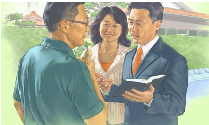
Has extendido a gran distancia todos los confines del país (Isa. 26:15)

Están muertos; no vivirán. Impotentes en la muerte, no se levantarán. Por lo tanto, has dirigido tu atención para aniquilarlos y destruir toda mención de ellos.