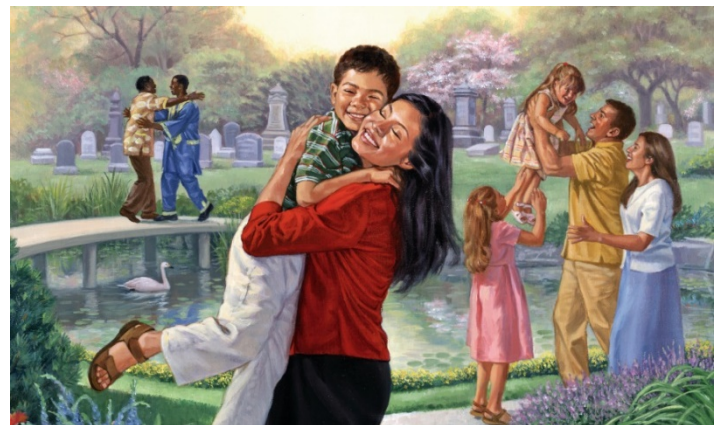
Tus muertos vivirán (Isa. 26:19)

19 “Tus muertos vivirán. Cadáver mío... se levantarán. ¡Despierten y clamen gozosamente, residentes del polvo! Porque tu rocío es como el rocío de malvas, y la tierra misma dejará que hasta los que están impotentes en la muerte caigan [en nacimiento].”