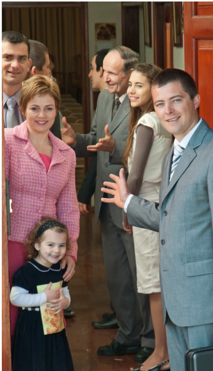
Anda, pueblo mío, entra en tus cuartos interiores (Isa. 26:20)

rocío de malvas, y la tierra misma dejará que hasta los que están impotentes en la muerte caigan [en nacimiento].