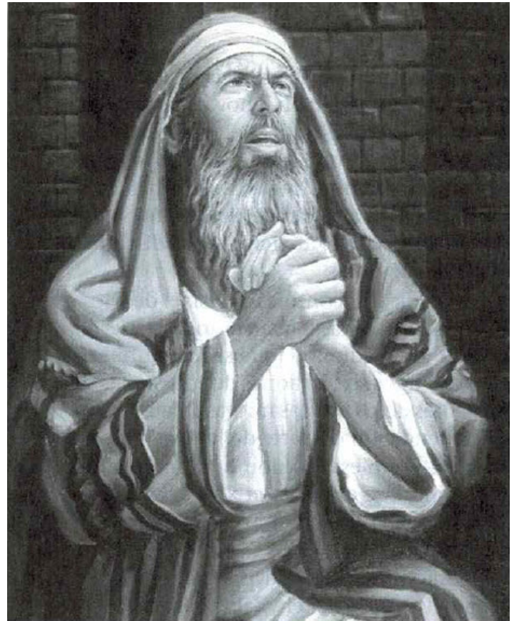
Isaías buscaba a Jehová "en la noche" (Isa. 26:9)

8 Sí, por la senda de tus juicios, oh Jehová, hemos esperado en ti . Por tu nombre y por tu memoria ha sido el deseo del alma.