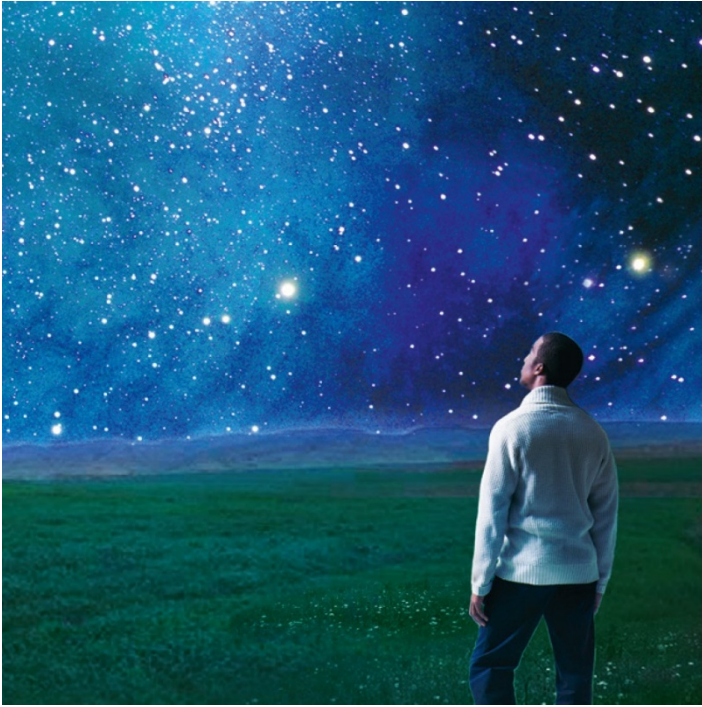
¡Miren! Este es nuestro Dios (Isa. 25:9)