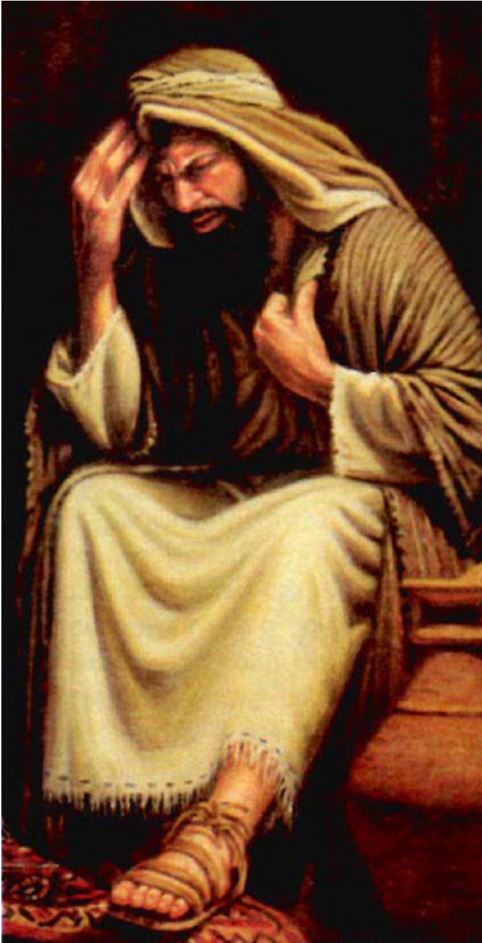
El dolor por lo que le sobrevendrá a su pueblo embarga a Isaías (Isa. 24:16)

mí hay flacura, para mí hay flacura! ¡Ay de mí! Los que en sus tratos son traicioneros han tratado traidoramente. Aun con traición los que en sus tratos son traicioneros han tratado traidoramente”