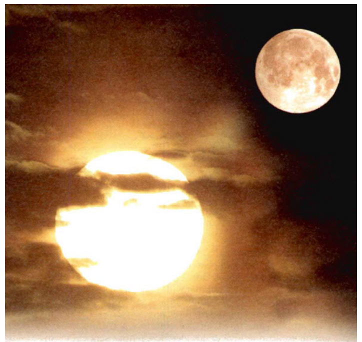
Ni el Sol ni la Luna se asemejarán a Jehová en esplendor (Is. 24:16)

21 Y en aquel día tiene que suceder que Jehová dirigirá su atención al ejército de la altura en la altura, y a los reyes del suelo sobre el suelo. 22 Y ciertamente serán reunidos como con la acción de reunir a prisioneros en el hoyo, y serán encerrados en el calabozo; y después de una abundancia de días se les dará atención.